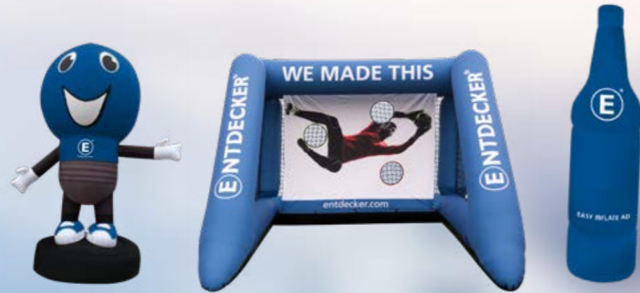
EASY INFLATE AD

Tragetasche zu transportieren und vor allem unglaublich schnell und von nur einer Person aufzustellen. Dieses Polyestergewebe kann einfach zu sehr individuellen Skulpturen verarbeitet werden, wobei der Boden des Easy Inflate Ads aus robustem PVC besteht. Außerdem zeigt das Polyester eine großartige Farbbrillanz.