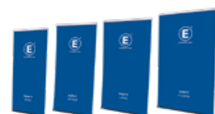
EASY-T Breite x Höhe