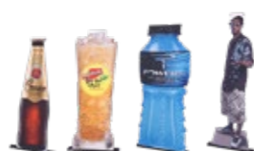
EASY-T SHAPE Breite x Höhe