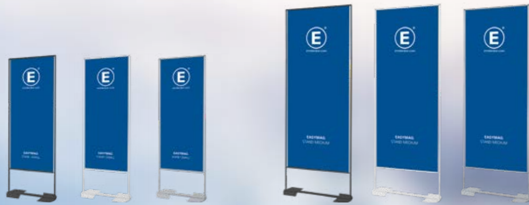
EASYMAG STAND 160

Vergleich zu herkömmlichen Roll-ups steht es immer gerade und lässt sich doppelseitig bedrucken, so dass es auch mitten im Raum einen guten Eindruck macht. Das Easymag Stand gibt es in drei Standardfarben: schwarz, weiß und silber.