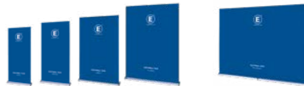
EASYWALL FLEX Breite x Höhe