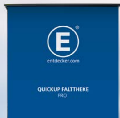
QUICKUP FALTTHEKE PRO

derungen von Messe- und Promotionständen adaptiert. Daher ist sie auch eher eine Klapptheke, denn sie wird einfach zum Aufbau auseinandergeklappt und schon steht sie absolut stabil und sicher.